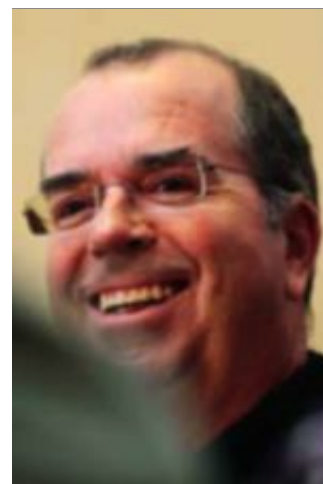
Jan Kjærstad: Om Norge.