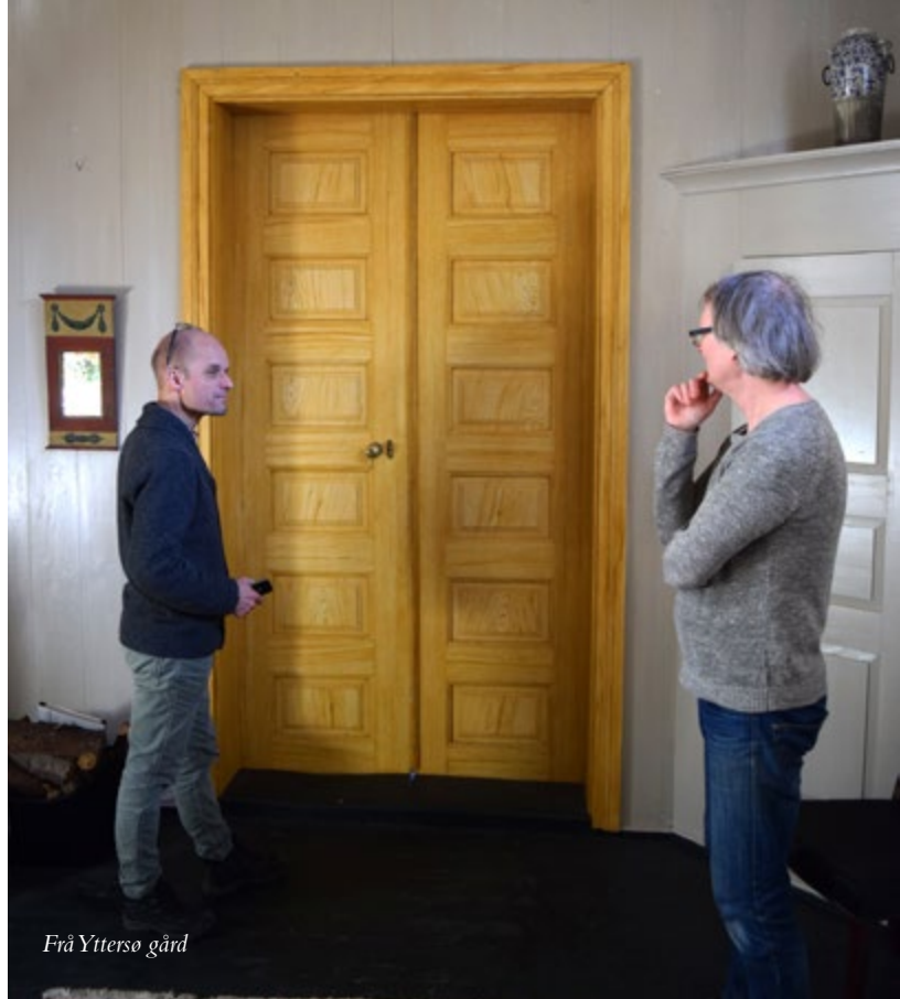
Frå Yttersø gård

– Kulturminnevern i klassisk forstand er en del av det totale miljøvernet, eksemplifisert i gjenbruk, kretsløp og tradisjonelle byggematerialer. Denne fellesnevneren har vært der lenge, men har miljøvernet oppdaget, erkjent og trukket konsekvensen av det? Og vice versa, tette hus kontra tradisjonell byggeskikk. Det totale kretsløpet handler om mer enn energilekkasjer, isolert. De senere årene har vi sett tømmerhus, vedovner og gamle vinduer truet av energiltak. Det burde være unødvendig å kjempe disse kampene i dag. At planavdelingen i det tidligere Miljøverndepartementet, nå Miljø- og klimadepartementet, ble flyttet over til Jan Tore Sanners kommunaldepartement, opplever jeg som en bevisst svekkelse og stikk i strid med den opprinnelige tanken bak opprettelsen av Miljøverndepartementet. Kulturdepartementet figurerer ofte som en alternativ plassering for kulturminnevernet, men jeg synes det