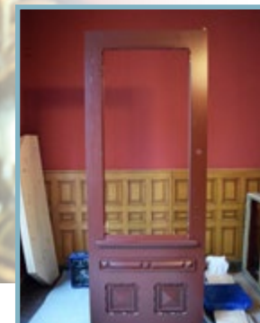
Den nye butikkdøren er nesten klar til innsetting. Den er kopiert etter en jevnaldrende dør i strøket og er utført i heltre.