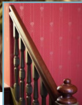
En blanding av gammelt og nytt. Trappen og håndløperen er laget av møbelsnekker Rune Hallberg, mens balustere og meglere er originale fra gården i Riddervoldsgate.