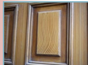
Brystningspanelet er ikke originalt i butikken, men stammer fra en tilsvarende gård i Riddervoldsgate. Etter hundre år er ådringen like fin, og treverket er uten en sprekk.