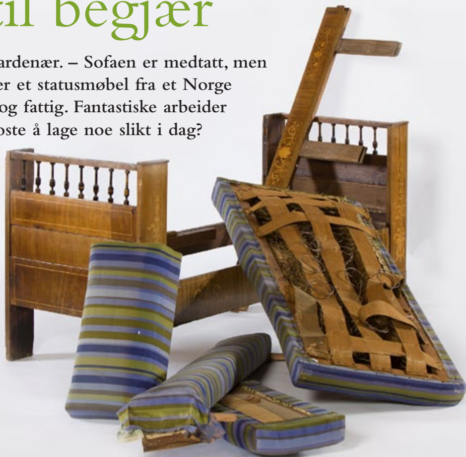
Den er et mistrostig syn, sofaen som en gang kan ha prydet en embetsmanns hjem i første halvdel av 1800-tallet. Løs rygg, løse puter, finérskader, fjærer på vei ut og et billig, moderne bomullstrekk.