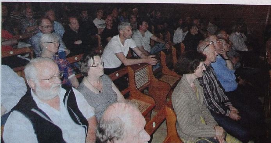
Mange fant veien til folkemøtet i Fredrikshalds Teater.

– Jeg er ingen bydoktor, uttalte han blant annet.