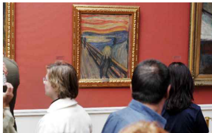
OVERFØRER KVALITETENE: «Vi som nå er med på å planlegge Nasjonalmuseets nye bygning på Vestbanen, er fullt klare over de kvalitetene dagens Munch-sal har, og vil sørge for at de også vil være å finne i det nye museumsbygget», skriver artikkelforfatteren.

Det finnes ingen nøytrale operasjoner, ingen nøytrale ofre – heller ikke i Norges krig anno 2011.