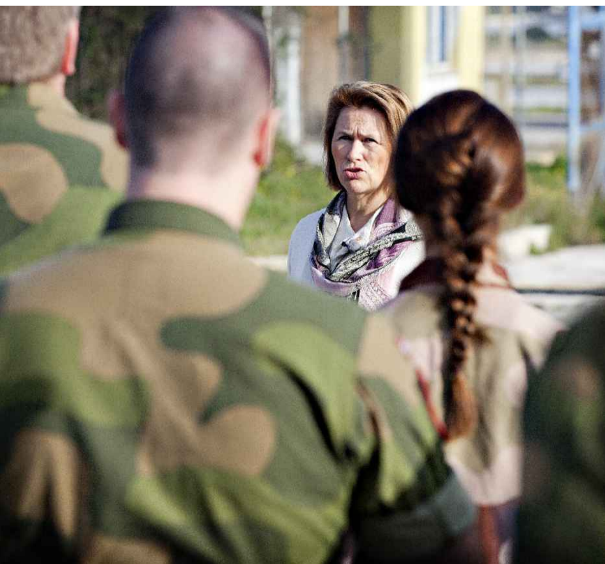
den norske styrken på Kreta. «Erfaringene fra 2. verdenskrig viser at det nesten ikke finnes grenser for hvilke

nomførte handlinger, vellykkede tokt og heltmodige dåder. De som gjennomfører disse drapene vil bruke tid på å forstå hva de har gjort, men når det sivile livet krever sitt, så vil relativt mange finne det vanskelig å leve videre med sitt ansvar.