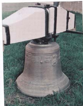
Bildene viser teksten på klokka slik den er beskrevet i teksten. Legg også merke til hvordan akslingene på klokkebommen er lagret opp i en firkant av hardvood.